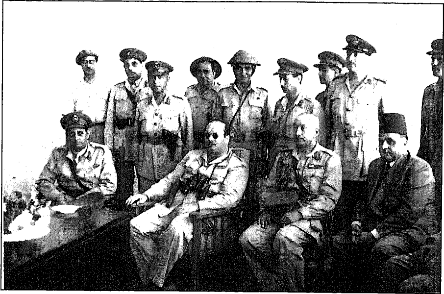
الملك فاروق بالزى العسكرى مع الضباط والجنود ويظهر كريم ثابت